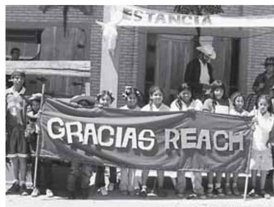
Pancarta de agradecimiento.