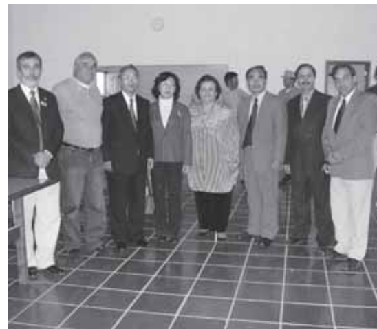
Autoridades el día de la inauguración.

Al principio de este año 2006 , se ha celebrado el quinto aniversario de esta institución, que es como decir, de REACH Paraguay, puesto que es la única institución propia, aunque ya tenemos funcionando una oficina alquilada en Asunción y estamos construyendo un hogar de niños en