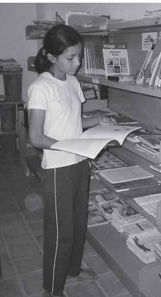
Biblioteca de la escuela.

Sin embargo, el voluntario no tiene un perfil específico en sí. Sí podemos