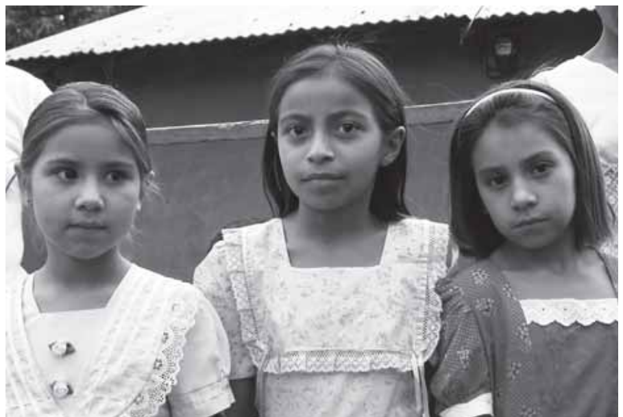
Tres niñas nicaragüenses de la aldea de Tomabú.

Las pasé adelante para conversar con ellas, me sorprendió su rol. Se levantan a las 4 h. de la mañana para alistarse y venir al colegio. Caminan