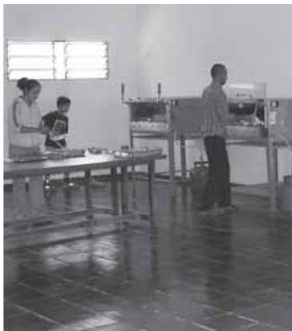
Vista del obrador de panadería.

En ese primer año, se construyeron las aulas de la escuela, oficinas , baños , otras dependencias y un aljibe para recoger agua de lluvia abastecer a las necesidades del edificio. Al año siguiente, en el 2002 , se añadió a las instalaciones educativas el internado para varones, también con su aljibe correspondiente. Ese mismo año, el Colegio Japonés de Asunción, donó a la escuela de REACH un motor generador para obtener electricidad. En 50 km. a la redonda no hay red eléctrica, ni agua potable, ni teléfono, con lo que las condiciones de vida son bien precarias. Al otro año, en el 2003 , debido al importante incremento del número de alumnos y a la necesidad de aumentar la plantilla de profesores se construyeron dos casas para profesores, una de ellas doble, puesto que no hay otra posibilidad de alojamiento en la zona. Por supuesto que cada una tenía su propio aljibe. Se recibió también de parte de la organización Prodechaco, una importante donación de mobiliario : mesas y sillas para la escuela, colchonetas y camas para los internados, etc. Se construyó en ese mismo año el segundo internado, el de las niñas. A