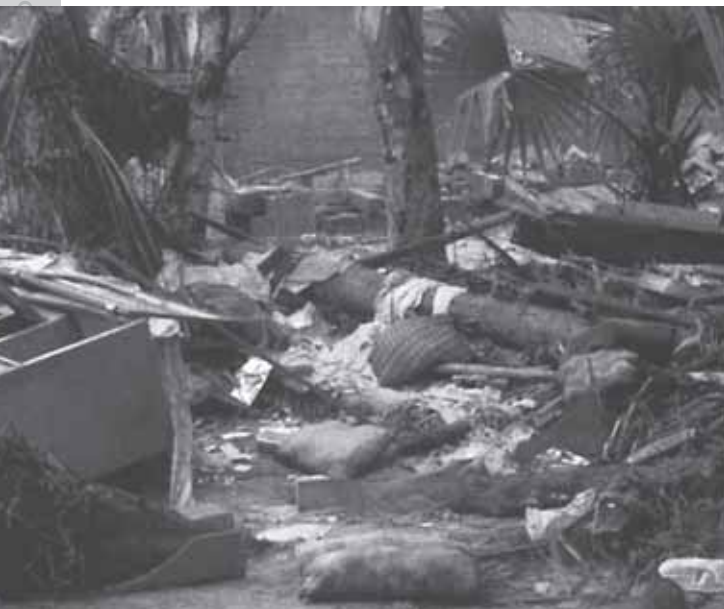
Una muestra de la destrucción causada por el tsunami.

Cementerios enteros fueron exhumados, calaveras y huesos quedaron es-