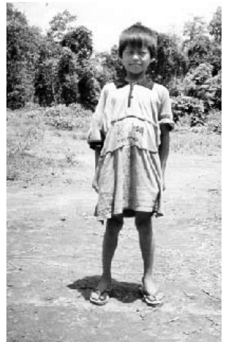
En las fotos observamos a dos de los niños tailandeses que pertenecen a nuestra escuela.

No hay mucho más que podamos decir, pero esta experiencia afirmó grandemente la fe de los estudiantes y profesores. Ellos creen que Dios envió ese estruendo para salvar sus vidas. Más tarde, las grandes lluvias mantuvieron varios meses alejados al ejército de la escuela. Muchos de los niños de REACH que se han convertido al cristianismo en el colegio, se han visto forzados a abandonar sus hogares a causa de la lucha en contra no sólo del grupo étnico Karen, sino también de los cristianos.