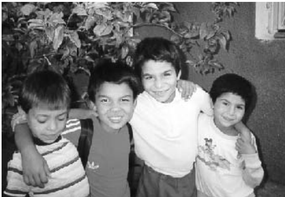
“REACH está creciendo firmemente creando para cada niño/a, de uno en uno, un mundo diferente.”

Guerras, crímenes, desastres naturales o desastres causados por los hombres, pobreza y una injusticia desenfrenada. Tragedia tras tragedia nos es arrojada en todas direcciones. En tales condiciones, todos sufren, pero los niños los que más. Escuchamos de abusos físicos, emocionales y sexuales, de padres que abusan y/o incluso matan a sus propios hijos. ¡En algunos países subdesarrollados los orfanatos los gobiernan con ayudas extranjeras para la prostitución! Muchos pederastas vienen de Europa o América, para hacer víctimas a los niños y niñas.