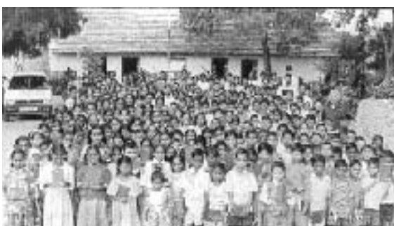
La escuela de Ranipet al completo.