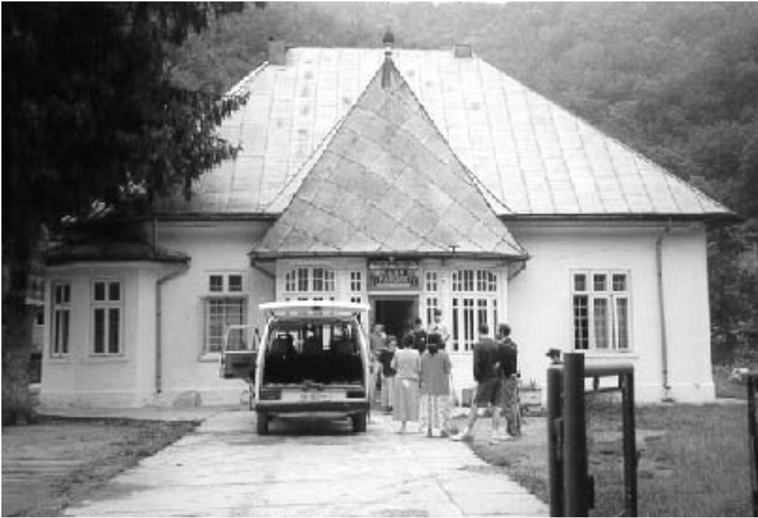
Casa de niños de Mislea (Rumanía).