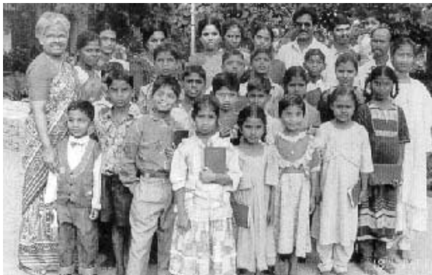
La autora con algunos niños en Ranipet

llosa de ver que había una institución con las propiedades adecuadas, poniendo a Dios en primer lugar en todo lo que hacían.