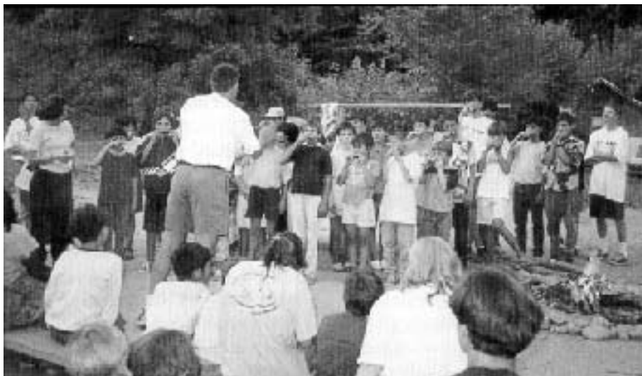
Primera actuación del coro de armónicas.

Nuestro grupo no solamente fue para ofrecerles un campamento. También llevamos 2.000 Biblias, 500 libros de "El Camino a Cristo" y 500 de "El Sermón del Monte", para ofrecérselo a todos los rumanos que conociésemos. Estos libros se trajeron gracias a una organización privada llamada "PROYECTO MUNDIAL", la cual recoge fondos para poder enviar Biblias a otros países en viajes misioneros. Estas Biblias y libros fueron la fuente de luz de nuestro viaje. Al principio planeamos que el grupo americano estuviese varias tardes en la comunidad, dándoles la Biblia, pero Dios tenía en mente un plan mejor. Parecía que todo estaba en sus manos, ya que constantemente hubo cambios que produjeron milagros. La primera vez