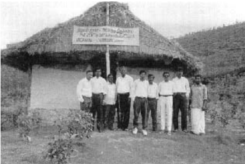
Foto superior: Iglesia construida por los niños de REACH y los nuevos miembros.