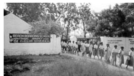
Niños saliendo de la escuela de Ranipet

REACH Internacional sirve a más de 25.000 niños en 16 países. Por favor, recordad estas instituciones en vuestras oraciones y apoyadles en todo lo que podáis dentro de vuestras posibilidades. La influencia de estos niños cuando vuelven a sus hogares se podría comparar con una fragancia suave y dulce. Comparten las buenas nuevas del evangelio con padres, amigos y vecinos. Sólo el cielo revelará el trabajo conseguido, gracias a los esfuerzos de REACH Internacional y de sus comprometidos colaboradores.