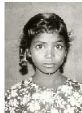
Una de las niñas de Ranipet