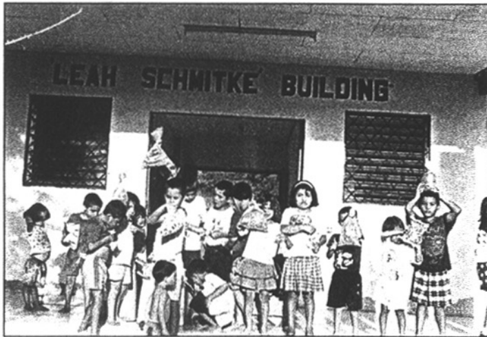
La leche en polvo que la Cruz Roja distribuía para los niños, no llega ya. No tienen fruta, ni verduras, ni hortalizas.

cosas muy necesarias para el Hogar. Suponemos que han sido arrastrados por el tremendo diluvio y el viento que no ha respetado allí casi nada.